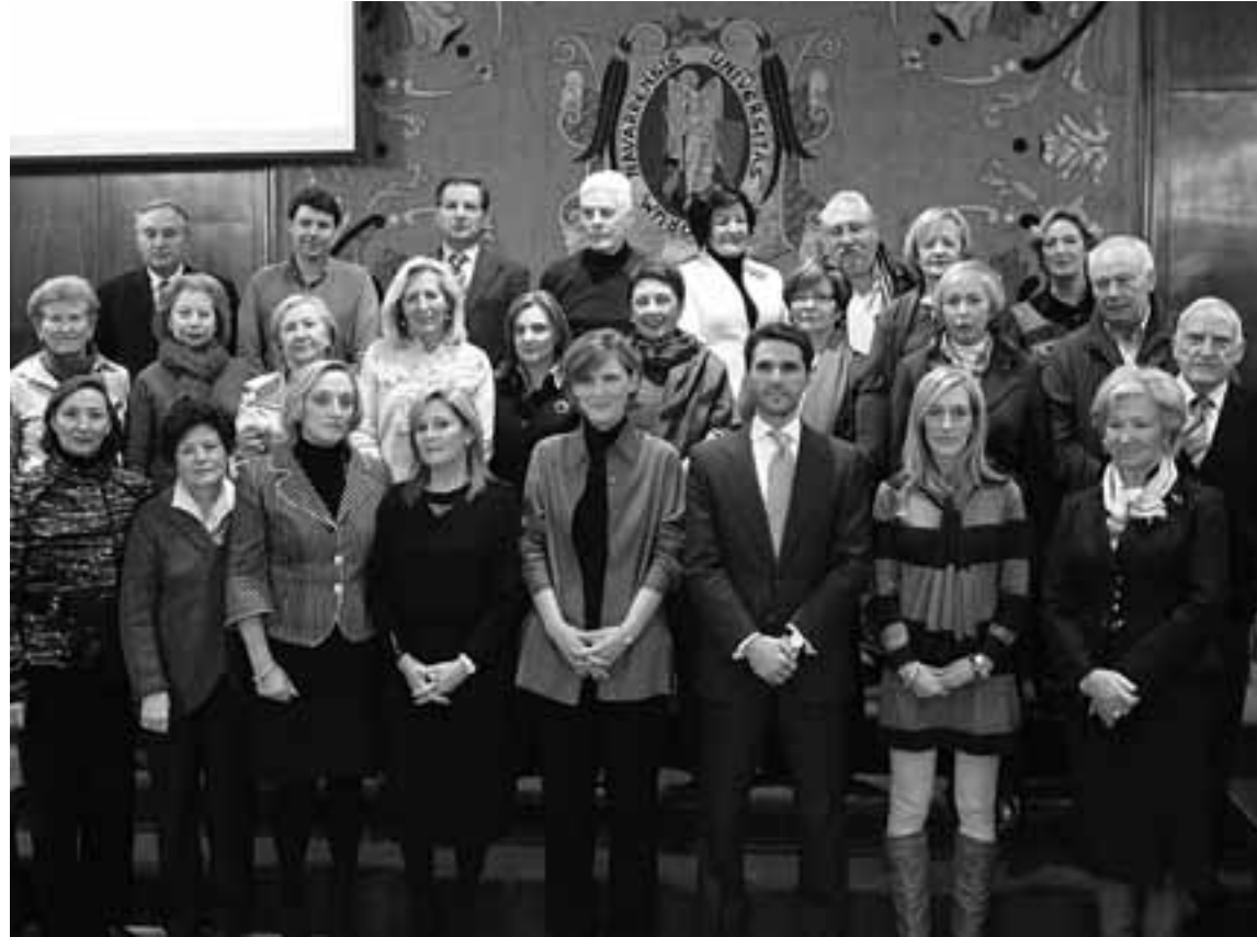
Alumnos del Programa Senior de la UN, junto a profesores y autoridades académicas.

"Ya estamos aquí otra vez", fue una expresión común ayer entre